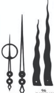
86 M 107 H 75