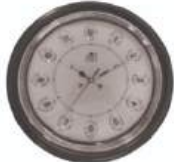
M.No. 295 - Deluxe Size :- 406 x 406

We are also the menu. of wall clocks & wall clock hands