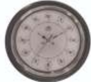
M.No. 295 - Deluxe Size :- 406 x 406

We are also the menu. of wall clocks & wall clock hands