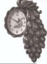
M.No. 308 Size :- 584 x 304