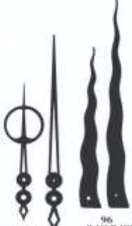
86 W 101 H 73